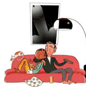
— Je suis juste surpris qu'un type que j'ai connu sous le pseudo de "DarkSexGoulé666" passe tous ses mardis soirs devant Les Meilleures Claqueffes de France, c'est tout !