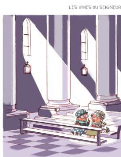
— Ecoutez, Gribble, le seul conseil que je peux vous donner c'est : « Restez gribble ».